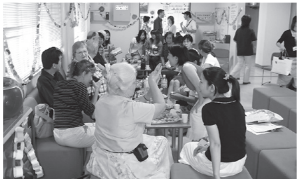
ミシガン友好親善使節団との交流会

や自治会、国際交流協会などの市民団体、NPOなど様々な主体が連携し、それぞれができることを明確にし、ながら進めていくことが重要です。外国人の方も支援を受けるばかりではなく、地域社会を構成する主体として、自分たち