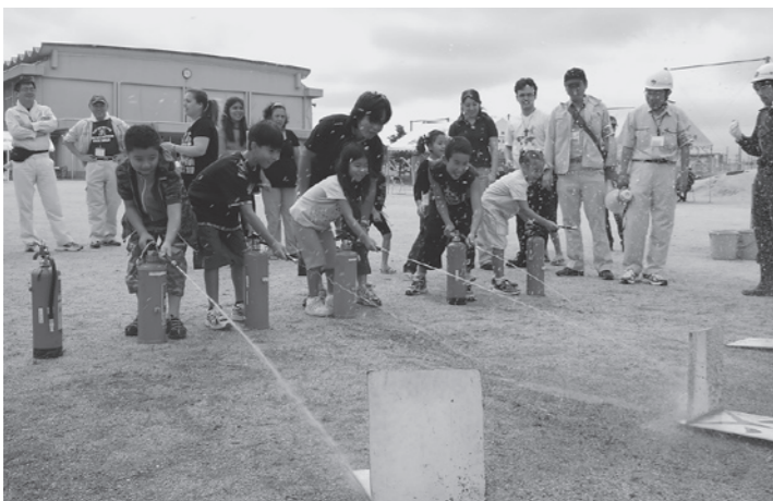
柏木小学校で行われた消火訓練

9月2日(日)に実施された滋賀県合防災訓練では、外国の方14名にも参加してもらい、消火体験、地震体験、避難所での心のケア講習、応急処置講習といった体験型の訓練を受けていただきました。