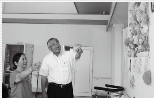
▲利用者の方が作られた手芸作品を見る長さんと市長

誰もの笑顔がこぼれるまちのためのヒントがこうした福祉施設の利用者の皆さんからも聞かせていただけます。