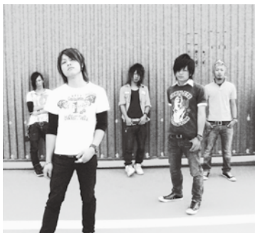
2nd STAGE (セカンド ステージ)