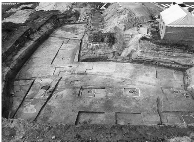
■発見された建物跡（白線内が建物の柱位置）

5月中旬から8月下旬にかけて試掘調査をおこなった鍛冶屋敷遺跡（信楽町黄瀬）で、役所跡と考えられる3棟の掘