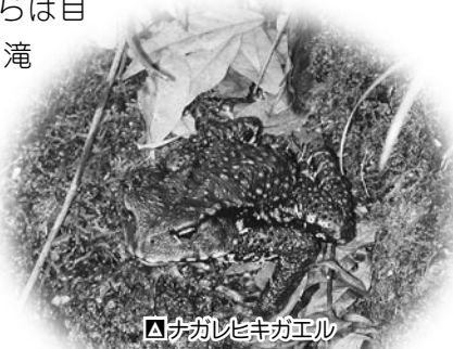
ナガレヒキガエル

ナガレヒキガエルは、ヒキガエルの仲間ですが、溪流に専門にすむ種類です。こちらは目立つ声では鳴きませんが、滝のそばの水しぶきがかかる岩などに、じっと座っている姿を見かけます。市内では、野洲川源流の溪流に限って見られます。