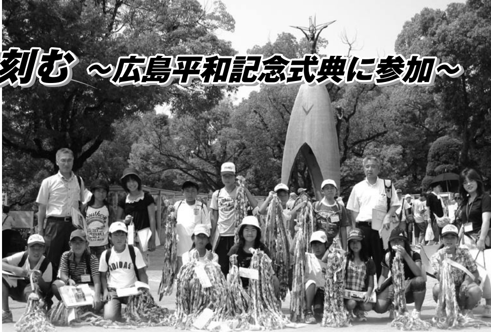
■原爆の子の像を前に平和を誓う参加者の皆さん

8月5日・6日の両日、市内小学校の6年生の代表が広島平和記念式典に参加しました。これは、二度と繰り返してはならない戦争・原爆の悲惨さと平和の大切さを深く認識してもらうことを目的に毎年実施しているものです。今年は例年より5名多い15名が参加しました。 5日は、平和記念公園内の原爆の子の像に市内各小学校などから託された折り鶴を捧げ、原爆ドームや資料館を見学し、宿舎では語り部さんから被爆