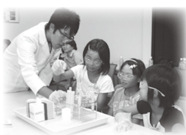
慎重に薬を調合する児童

児童は普段見たことのない不思議な実験に興味深く観察、体験し、科学の不思議さ、おもしろさを発見できたようです。