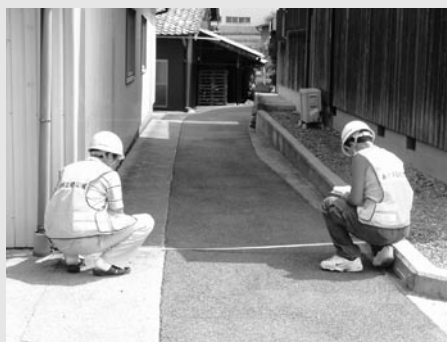
■危険箇所を現地調査する「ぼうさいウォッチング」

これからも、連携を強化し、コミュニケーションをとりながら徐々に充実した組織になるよう進めていきたいと思っています。