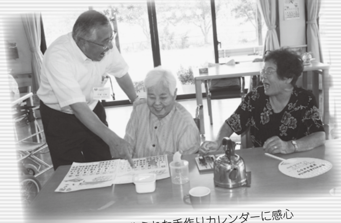
▲丁寧に作られた手作りカレンダーに感心