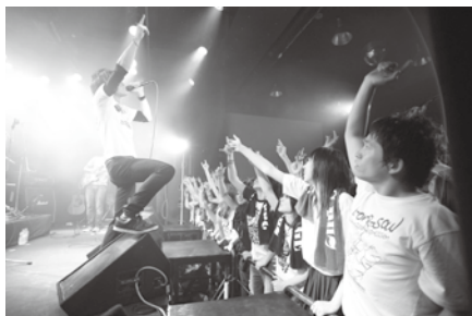
バンドとファンが一体、熱いステージ

月に、別々に活動していた2つのバンドが合体、「自分たちの音楽で日常とは違う別の舞台を作り、そしてその舞台をみんなと共有したい」という思いから2nd STAGE