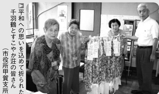
■平和への思いを込めて折られた千羽鶴とすこやか荘の皆さん (市役所甲賀支所)

今年も色とりどりの丁寧に折られた鶴が届き、すこやか荘の皆さんの思いは児童によって広島へ届けられました。