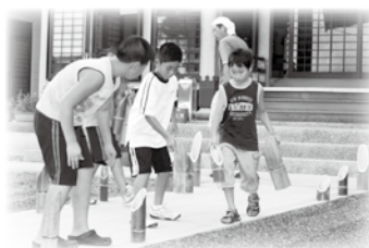
完成した竹灯籠を並べる地元児童

り、端を斜めに切り、節を丁寧に取り、その中にろうそく立てを入れて完成。こうしてできあがった200個の手作り竹灯籠、灯りがともるとまるでそこからかぐや姫が出てくるかのようなのです。