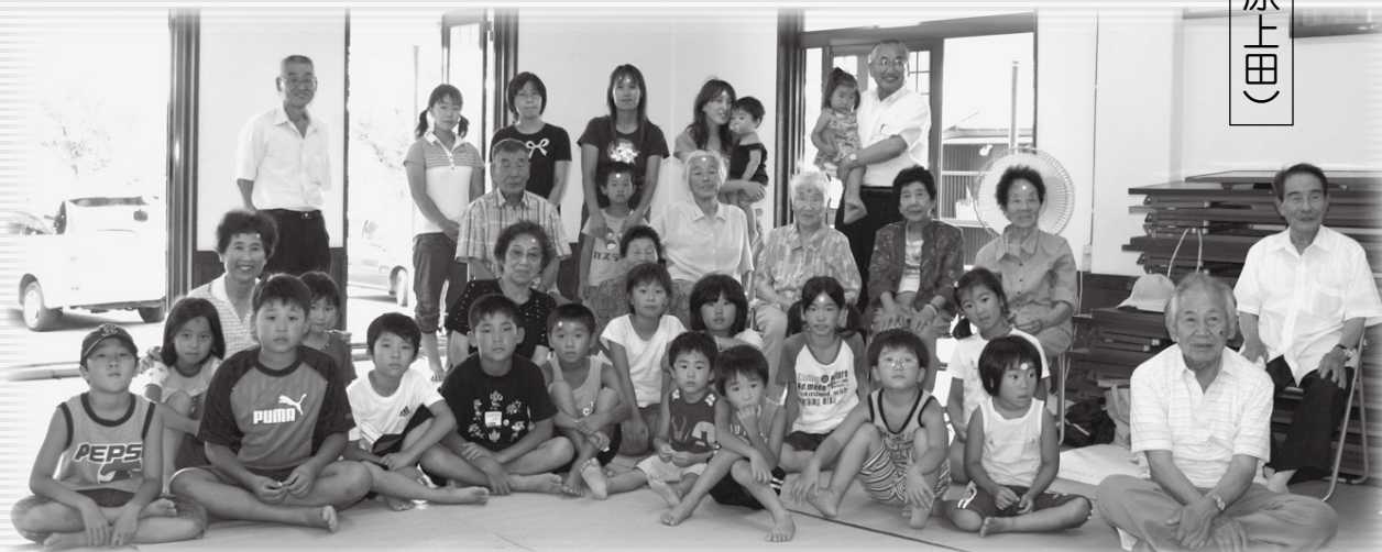
▲ほっとサロン参加者の皆さんと