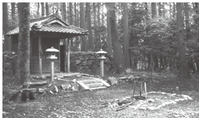
■山頂にひっそりたたずむ津嶋神社

以前は、子どもたちも一緒に山に登り、木の実を採って食べたり、セミなど捕まえて遊びました。真っ黒に日焼けした元気な子ども