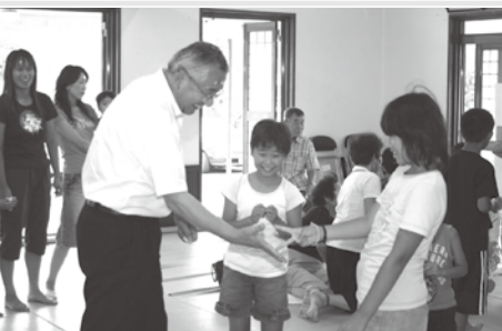
▲じゃんけんゲーム負けると罰ゲームが