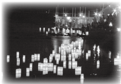
川面をオレンジ色に照らす灯籠