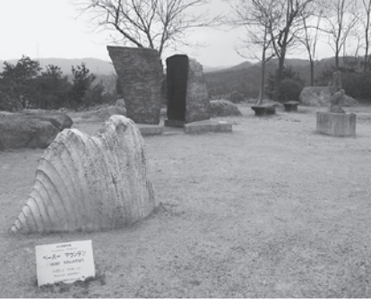
▲ 屋外に陶芸作品が展示してある陶芸の森「星の広場」③