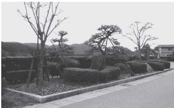
▲旧東海道にある公園③

最後にも一つ、この道の駅も単なる休憩や情報発信施設でなく、気軽に会話が楽しめる、旅の思い出に残る場として、旅の