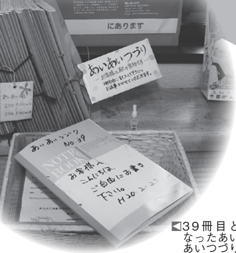
といたり 目あつ 39冊な ないあ

ドライブされる方に休憩・情報発信、地域の連携を目的に平成5年に全国的に設立された道の駅、その中で、あいの土山は近畿で最初に登録された施設の一つです。 自慢の土山茶の無料サービスのほか、訪れた人が旅の思い出を書き込むノート「あいあいつり」では書き込まれた方全員に返事を出すなど、真心こもったサービスでおもてなします。