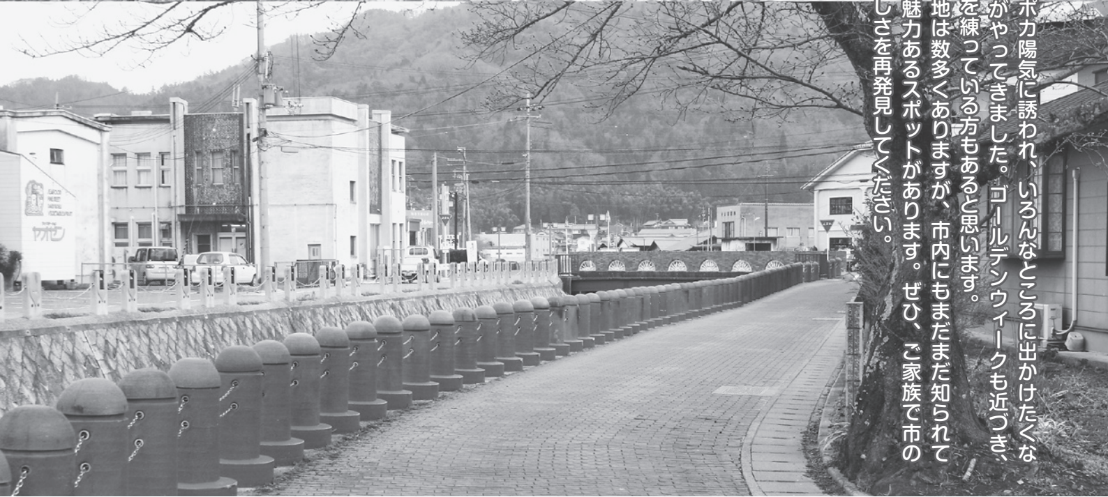
▲上／かもしか荘に隣接する大河原グラウンドゴルフ場 下／ すえみ 陶美通り

ポカポカ陽気に誘われ、いろんなところに出かけたくなる季節がやってきました。ゴールデンウィークも近づき、プランを練っている方もあると思います。観光地は数多くありますが、市内にもまだまだ知られていない魅力あるスポットがあります。ぜひ、ご家族で市の素晴らしさを再発見してください。