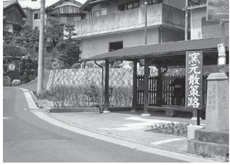
▲ まちなかのポケットパーク②

さらに陶芸の森では、多くの陶芸資料の展示以外にも四季折々の草花の中に、陶芸作品が設置され、自然の中で陶芸作品を楽しみながら散策ができます。