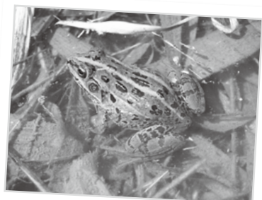
ナゴヤダルマガエル

やすく、日当たりの良い草地や荒地が広く存在した地域です。近年は人の手が入らなくなり数十年を経て、コナラの大木や笹藪が増えましたが、カヤネズミやサ