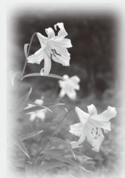
甲賀市の花：ササユリ

甲賀市人権教育基本計画は、旧5町の「人権教育のための国連10年行動計画」を引き継ぐとともに、人権・同和問題意識調査や総合実態調査の結果をうけ、甲賀市総合計画のもと人権教育・啓発の新たな実施計画として策定しました。