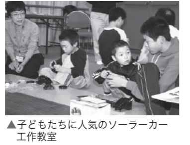
▲子どもたちに人気のソーラーカー工作教室

ま なびの体験広場2009と甲賀市エコフェスタが11月21日、忍の里プララで同時開催されました。 まなびの体験広場では、市内の高校や専門学校生、シルバー人材センターの会員が各体験コーナーの先生となり、子どもたちと交流を深めました。 また、エコフェスタでは、環境に優しい暮らしを提案するブースが並び、参加者一人ひとりがエコライフについて考える機会となりました。