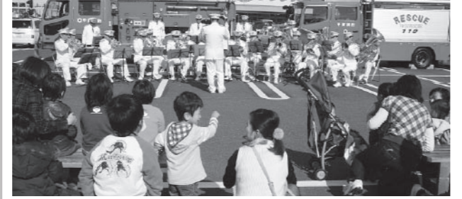
▲家族連れなどを楽しませた消防音楽隊の演奏

消 防フェアが11月21日、水口にある量販店駐車場で開催されました。火を取り扱うことが多くなるこの季節に住民の皆さんの防火意識を高めてもらうと甲賀広域行政組合水口消防署が主催。会場には消防車両が展示され、濃煙体験のできるスモークハウスも設けられました。また、消防署員らが啓発品を配布しながら住宅用火災警報器の設置を呼びかけました。 消防職員による消防音楽隊の演奏では、人気の歌謡曲やサイレンの音を取り入れた消防のテーマソングなどが披露され、買い物に来た家族連れを楽しませました。