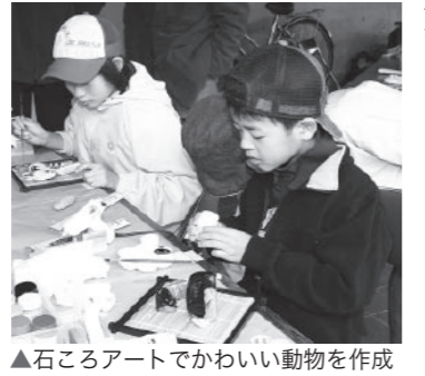
▲石ころアートでかわいい動物を作成