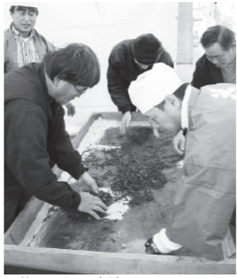
▲茶まつりで実演された昔ながらのお茶の手もみ

お 茶にふれあいながら文化の秋を満喫しよう。11月23日、朝宮茶まつりと地域文化祭が合同で開催され、多くの皆さんでにぎわいました。 茶まつりは地域産業である茶業に感謝しようと開催されているもので、また文化祭では、地域の皆さんの作品や、家庭に残る古い新聞や昔の教科書などが展示されました。 今年特別企画として、朝宮小学校児童による朝宮茶摘み唄などの合唱が披露され、地域が一体となったイベントとなりました。