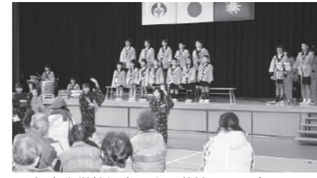
▲朝宮小学校児童による茶摘み唄の合唱