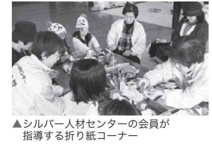
▲シルバー人材センターの会員が指導する折り紙コーナー