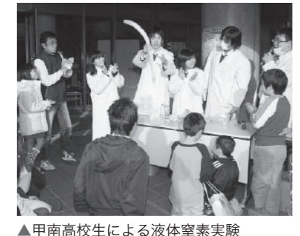
▲甲南高校生による液体窒素実験