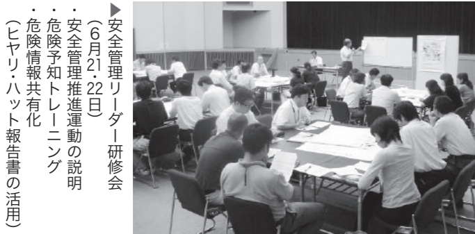
▶安全管理リーダー研修会 (6月21・22日) ・安全管理推進運動の説明 ・危険予知トレーニング ・危険情報共有化 (ヒヤリ・ハット報告書の活用)

各職場での危険を想定した研修が効果的に行われているかについては、所管している課長が安全管理推進委員となり、管理監督を行います。 まず、新たに設置した安全管理推進リーダーに対する危険予知などの事前研修を6月21日、22日の2日間、計3回に分かれ実施しました。また、自然体験活動に関わる職員を対象とした自然体験活動担当職員研修(4回実施73名受講)や市内の青少年団体の指導者を対象とした青少年自然体験活動団体指導者研修(31名受講)を継続的に開催しています。