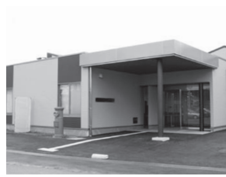
▲水口医療センターの新しい診療所(水口町貴生川)