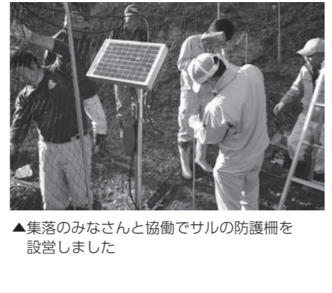
▲集落のみなさんと協働でサル防護柵を設営しました

●鳥獣害対策・有害鳥獣駆除事業 2,021万円 二ホンジカやイノシシなどの防除対策や、鳥獣捕獲による適正な個体数調整を行いました。 ●鳥獣害対策・有害鳥獣駆除事業 2,021万円