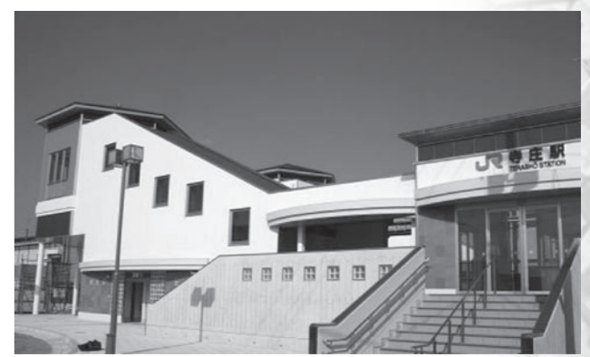
▲昨年12月に完成した新しいJR寺庄駅

●活力あるむらづくり事業 4,203万円 集落営農組織や認定農業者に対して作業機械の導入や農産物直売施設の整備を支援しました。 ●緊急雇用対策事業 1億6,242万円 162名の離職された非正規労働者の方などに、一時的雇用や就業機会を創出しました。