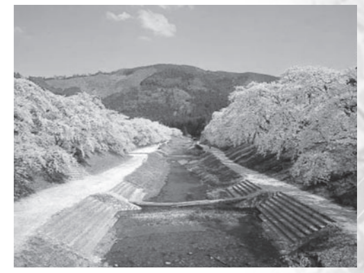
▲うぐい川の桜並木(土山町鮎河)

●市民と行政の協働により、まちの成長力を高める ●新しい地域コミュニティ推進事業〈新規〉 1億7,553万円 自治振興会の発足に向けて、モデル事業に取り組む地域に助成しました。