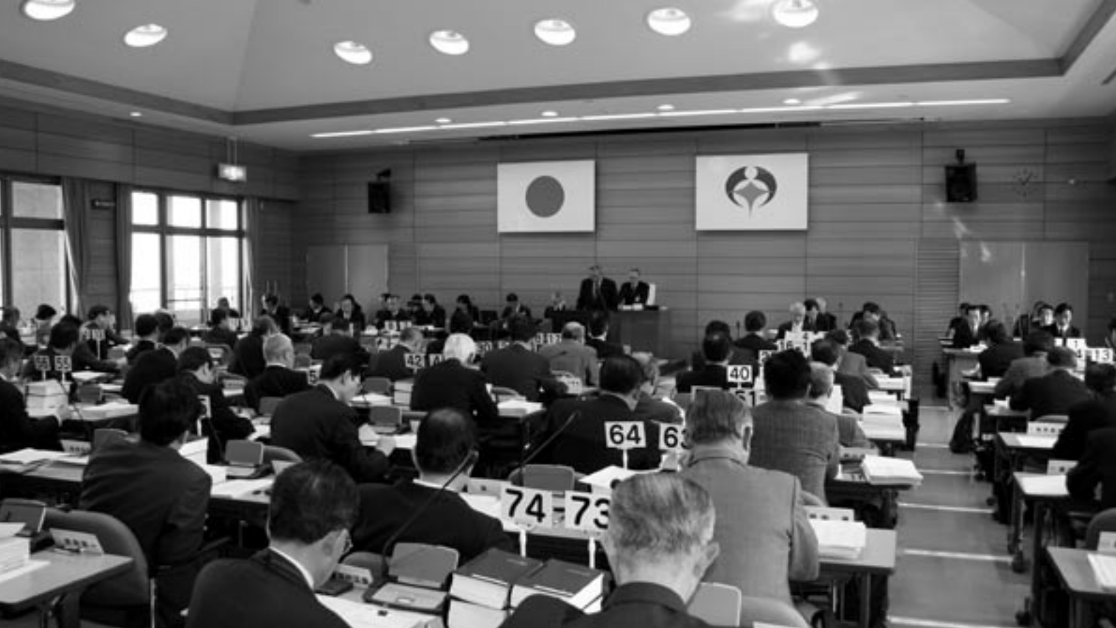
▲ 第2回定例会の様子