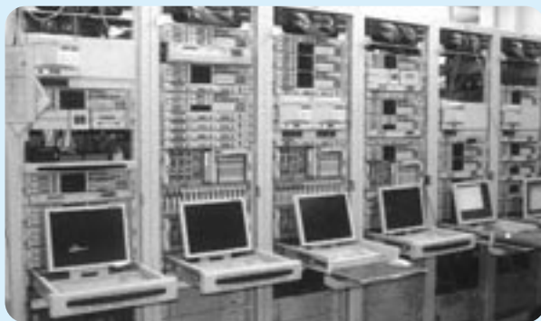
▲多数の機械が並んでいます。

情報通信技術の急速な進展にともなって、個人情報の取り扱いはずっと拡大していきます。甲賀市の情報システムでも、コンピュータやネットワークを利用して様々な個人情報を取り扱っています。これからも個人の権利や利益を守るため「甲賀市個人情報保護条例」に基づき、情報セキュリティ対策に努めると共に、市民の暮らしに役立つ「情報化」を進めます。