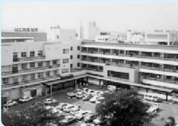
▲現在の公立甲賀病院

合併前から、移転先(水口町虫生野地先の丘陵地)となる関係地域への説明会などを開催してきましたが、具体的な整備計画を示せない状況でもありました。今年度は、関係住民の皆様へのご理解とご協力を得るため、基本測量調査を基に諸要件を整えながら地元への説明を行うなど、移転地の用地取得と関連する道路計画や造成計画を進めたいと考えています。