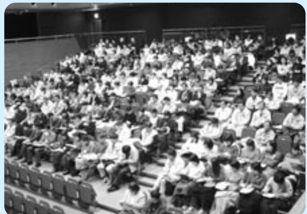
▲職員の意識改革のための研修

合併して約9か月が経過しました。5町から集まった職員同志も最初は戸惑いがちでしたが、徐々に業務に馴染んできたといえそうです。ただ、職員の仕事に対する心構えや、市民の皆さんに対する接客や電話対応などのサービスにもばらつきがあることに対し、甲賀市職員として意識と行動をひとつにしていく必要があります。それが、市民の皆さんの満足度にもかかわってくると思います。そういう意味で、今年度は特に、電話対応や接客等を通じて、市民サービスの向上と職員の意識改革をめざした研修を実施していきます。