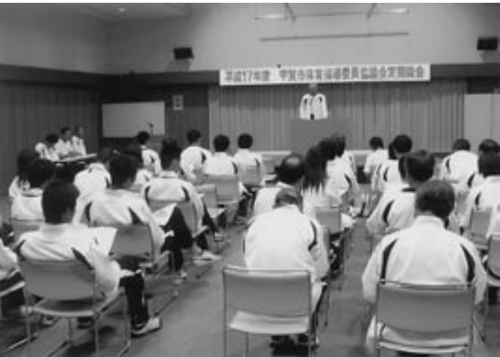
▲ 総会には全員が揃いのユニフォームで参加

市体育指導委員協議会は昨年の10月に発足し、間もなく1年が過ぎようとしています。協議会では新年度に入り7月2日に総会を開催しました。