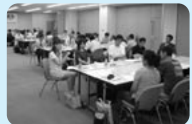
▲市民活動の会の様子