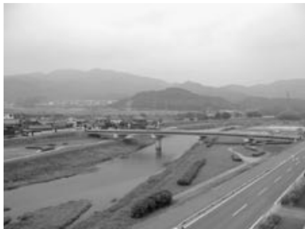
▲豊かな自然に囲まれて（介護療養型病棟・談話室より撮影）