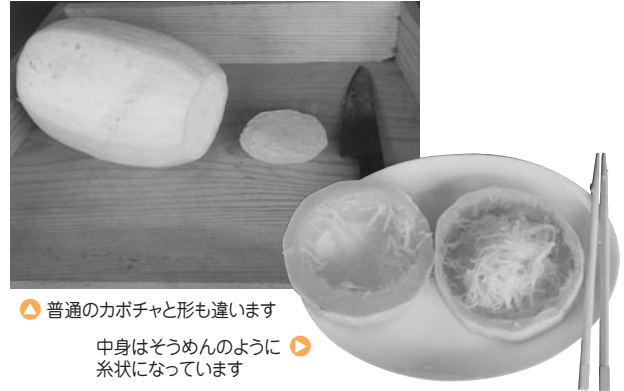
▲ 普通のカボチャと形も違います