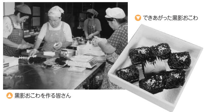
▼ できあがった黒影おこわ