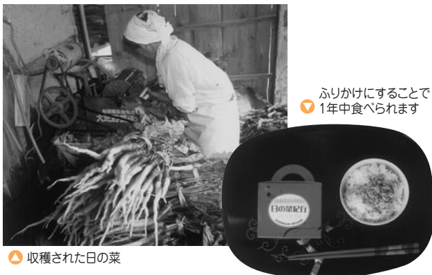
▲ 収穫された日の菜