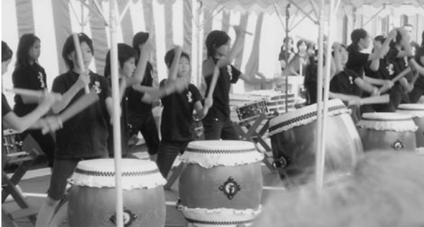
▲ 忍玉太鼓団の演奏で開幕

今回は昨年、神地区で開催された「～忍の里 甲賀～ 里山かむら 交流秋まつり」取材しました。