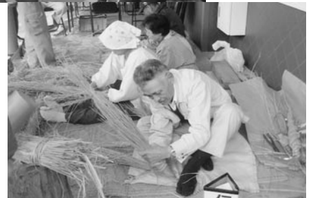
▲ 少し難しそうです

また、老人クラブのご指導で子どもたちが昔の遊び体験で竹馬や竹とんぼ作りにより和やかな交流風景もみられました。