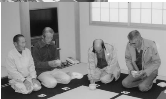
▲ どなたも少し緊張した様子でした