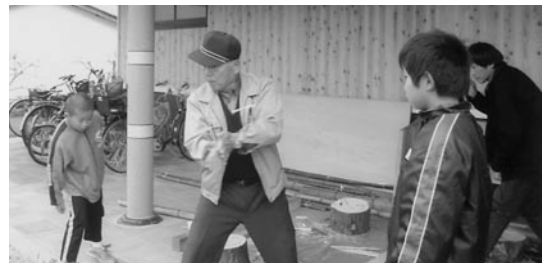
▲ 子どもたちに人気があった竹トンボ

まだ桜の木の香りが残る広々とした立派な建物と機能的な配置、広い駐車場に区民約150人が集まる中、それぞれの「食と農」「環境」「伝統」をテーマにしたアイデアを持ち寄りすべて手作りのイベントが始まりました。