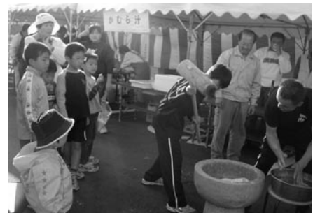
▲ やっぱり甲賀はもちで決まり!