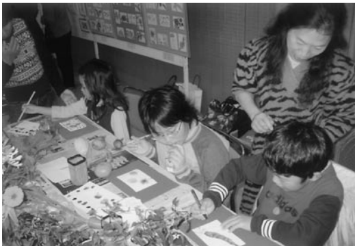
▼ 絵手紙に熱中する子どもたち

ドンドンドンドコドンドン 澄みきった秋の大空に総勢34人の元気な忍玉太鼓の演奏により開幕されました。