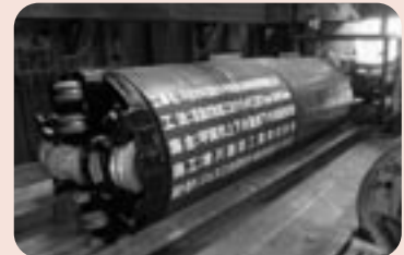
Ⓐ 地表を掘削せず管渠を推す推進工法の先端の推進機

また、設計に際しても事前に現地調査や測量などご家庭の敷地内に立ち入らせていただくことがありますので、併せてご協力をお願いします。