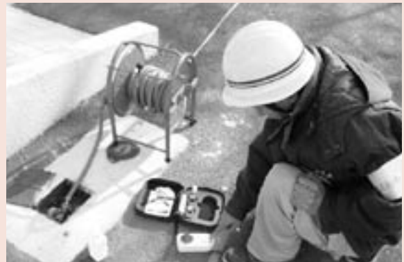
▲安全な水をお届けするため水質検査を行っています

これから本格的な冬がやってきます。特に寒気が近づくとつれ屋外の水栓は凍結破裂が予想されます。各ご家庭にあっては凍結防止対策をお願いします。また、下水道工事などに伴い仮設水道管をご利用の皆さんにおかれましては、仮設管の凍結による断水も予想されます。ご面倒をおかけしますが、上水道工務課もしくは最寄りの支所地域振興課までご連絡いただきますようお願いいたします。