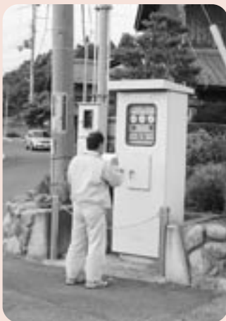
下水道ポンプが作動しているか確認します