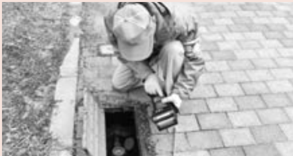
▲水道メーターの検針についてもご協力ください