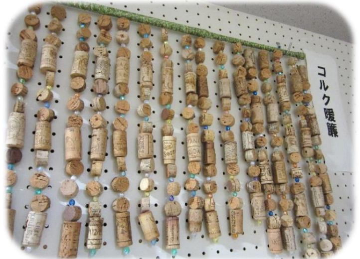
割れやすいコルクに一つずつ穴をあけ、テグスを通して「コルクのれん」を作りました。