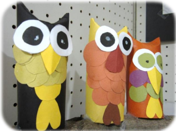
トイレットペーパーの芯を再利用し、いろいろな表情の「みみずく」ができました。

日ごろから四季折々の作品を製作しており、施設内や併設するみなくち診療所で展示していましたが、今回のように文化祭に出展することで多くの方の目に触れることとなり、利用者様の創作意欲の向上につながると感じています。手指の動きや脳の働きを活性化させる効果にも期待し、今後も継続して取り組んでいきたいと思えます。