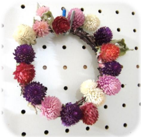
庭で育てた花やつるをドライフラワーにしてリースを作りました。